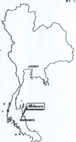
แผนที่ประเทศไทย