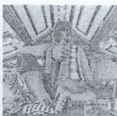
ตาพรานบุญ