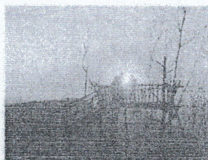
จุดชมวิวยเขาท่าข้าม

ปัจจุบัน องค์การบริหารส่วนตำบลควนหนองหงษ์ มีวิสัยทัศน์การพัฒนาท้องถิ่นคือ “เน้นนำบริการที่ดีมุ่งสู่สังคมแห่งคุณภาพ มีสาธารณูปการครบครัน และสิ่งแวดล้อมดี”