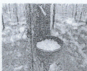
สวนยางพารา