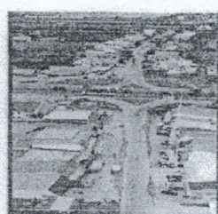
สี่แยกควนหนองหงษ์