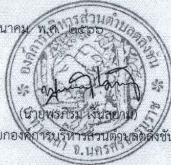
นายกองค์การบริหารส่วนตำบลดงลิงชัน