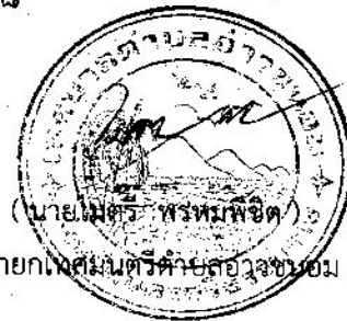
นายกเทศมนตรีตำบลอ่าวขนอม