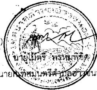
นายมนตรี พรหมพิงค์ นาย ก.ค.มนตรีตำบลอำเภอขนอม