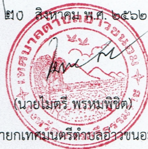
นายกเทศมนตรีตำบลอ่าวขนอม

หมายเหตุ ผู้ประกอบการสามารถจัดเตรียมเอกสารประกอบการเสนอราคา (เอกสารส่วนที่ ๑ และเอกสารส่วนที่ ๒) ในระบบ e-GP ได้ตั้งแต่วันที่ซื้อเอกสารจนถึงวันเสนอราคา